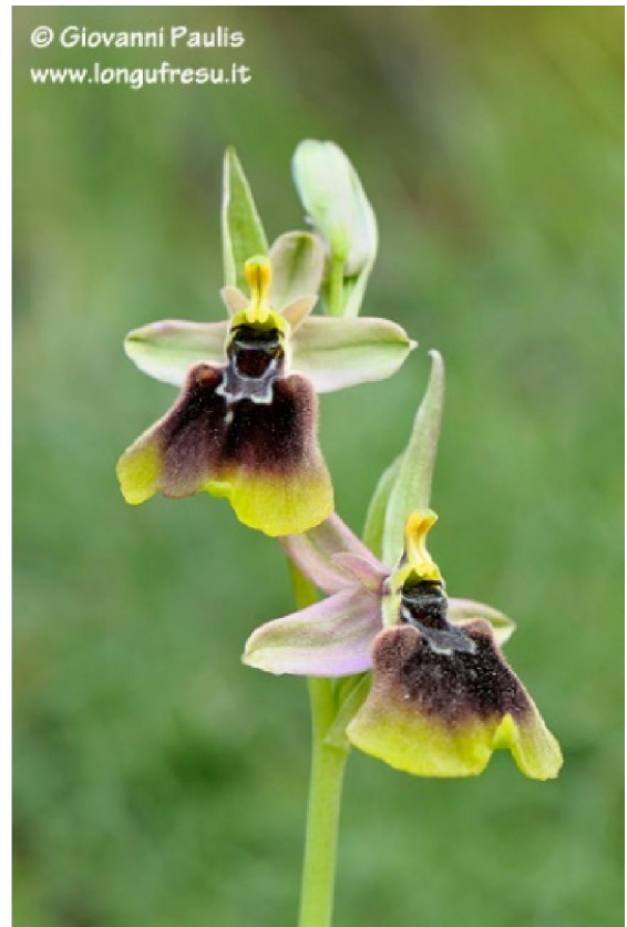
le Ophrys normanii

Tre giorni immersi in un ambiente nel quale storia, archeologia mineraria e bellezze naturali, formano un connubio che vi rimarrà nel cuore e nella mente